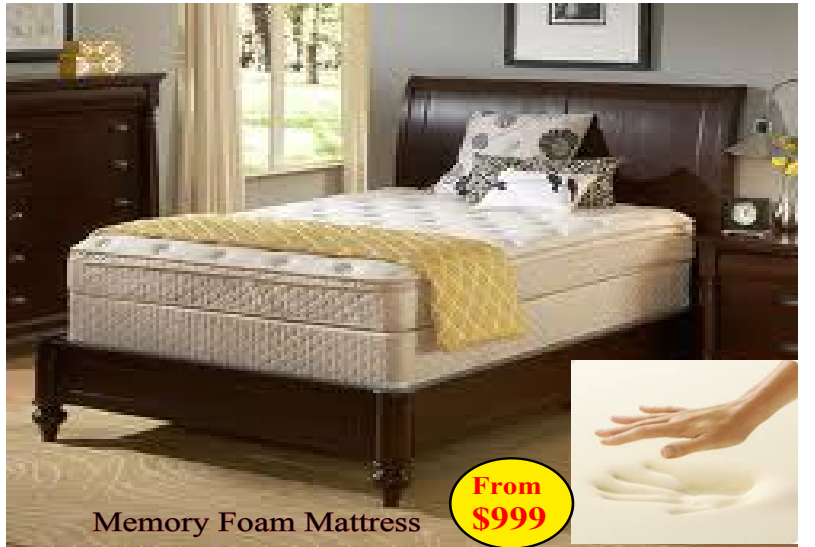
Memory Foam Mattress