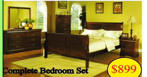
Complete Bedroom Set