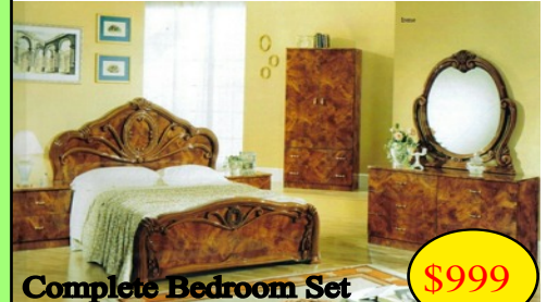
Complete Bedroom Set