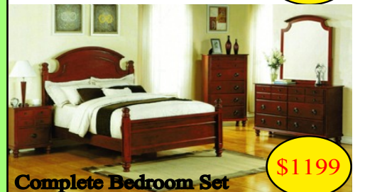
Complete Bedroom Set