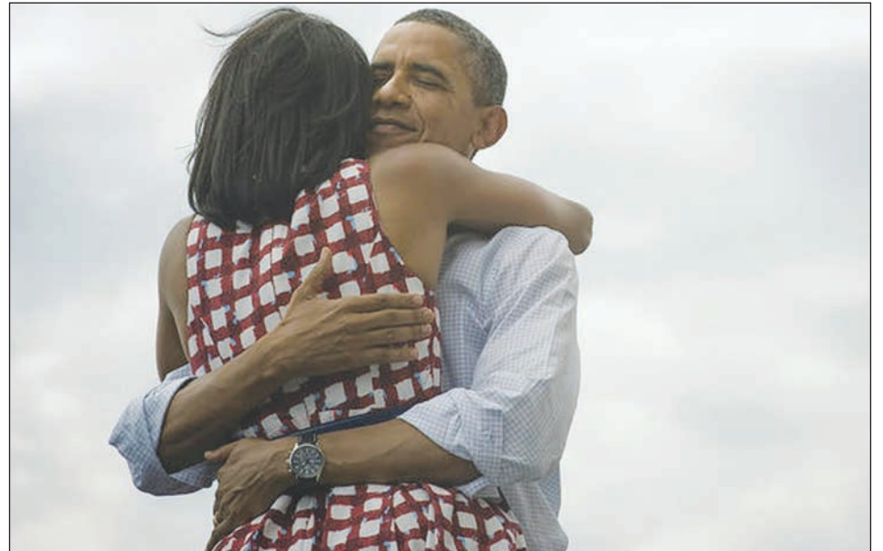
வெற்றியை கொண்டாடும் அமெரிக்க ஜனாதிபதி ஓபாமாவும் அவரது மனைவியும்.

தற்போதைய தேர்தலில் ஓபாமா ஐம்பது வீத வாக்குகளை மட்டும் பெற்றிருந்தாலும், தேர்தல் வாக்கு முறையில் 303 வாக்குகளைப் பெற்று வெற்றியடைந்திருக்கிறார். ஓகையோ மாநிலத்தில் வெற்றி தனக்குக் கிட்டும் என்ற நம்பிக்கையில் றொம்னி கடைசி நேரம் வரைக்கும் தோல்வியை ஒப்புக் கொள்ள மறுத்துக் கொண்டிருந்தார். புளோரிடாவின் எண்ணிக்கையும் தாமதப்பட்டதும் இதற்கு இன்னொரு காரணம். ஆனால், இந்த இரண்டு மாநில வாக்குகளும் கிடைக்காவிட்டாலும், ஓபாமாவின் வெற்றி நிச்சயம் என்ற