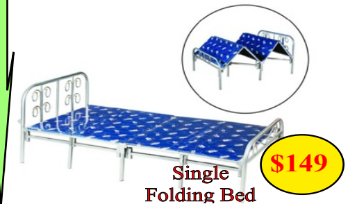
Single Folding Bed