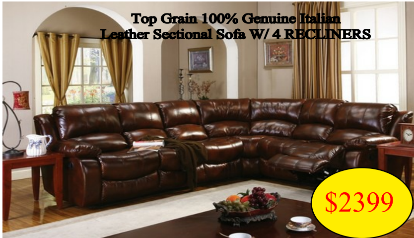
Top Grain 100% Genuine Italian Leather Sectional Sofa W/ 4 RECLINERS