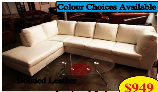
Colour Choices Available