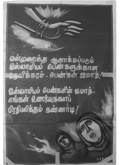
தமிழ்நாடு இஸ்லாமியப் பெண்கள் ஜமாத்தினரால் முன்வைக்கப்பட்டுள்ள அமைப்பின் கொள்கை ரீதியான வாசகங்களில் சில....