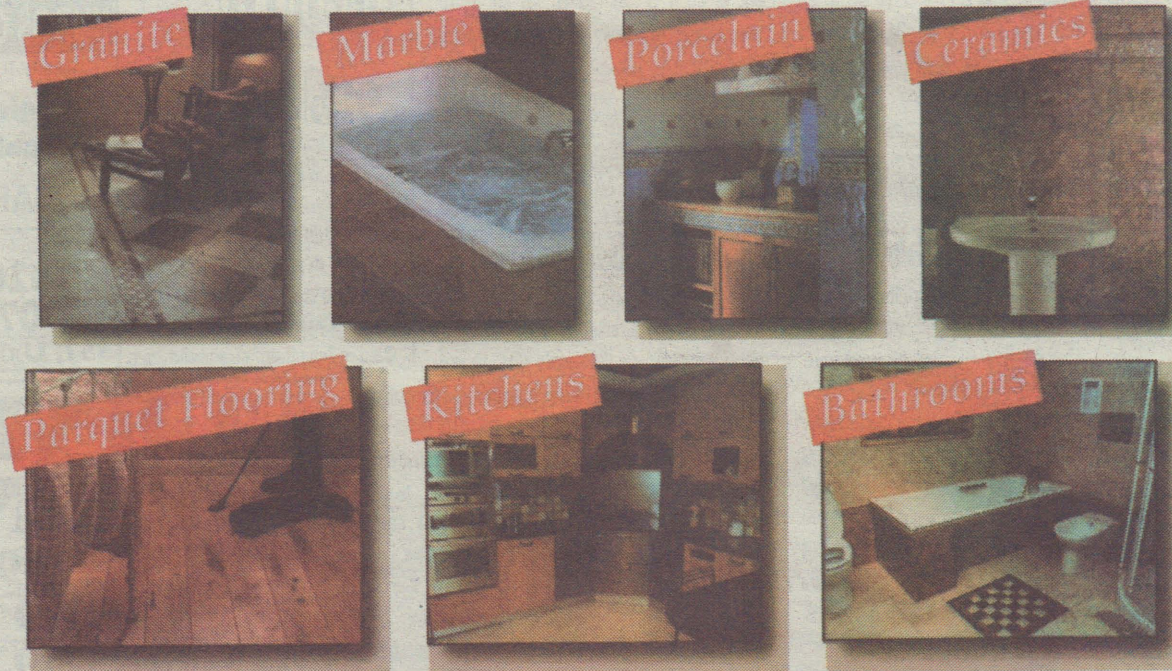
Specialists in Granite Worktops and Marble Vanity Tops to order

ELITE TILES are undeniably UK's No.1 Importers, Distributors, Wholesalers and Retailers of