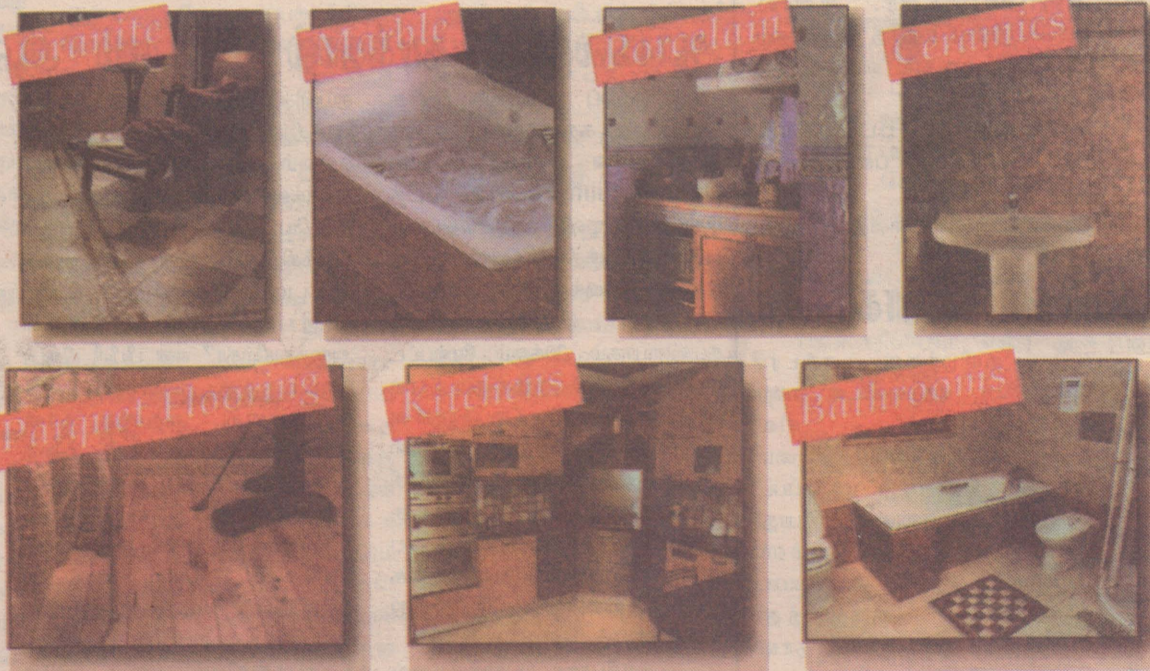
Specialists in Granite Worktops and Marble Vanity Tops to order

ELITE TILES are undeniably UK's No.1 Importers, Distributors, Wholesalers and Retailers of