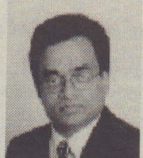
ர.கொன்ஸன்ரைன் செய்தி ஆய்வு நிருபர்

துணை நிருபர்கள் : கே அரவிந்தன் (இலண்டன்) ஜெ வெற்றிச்செல்வன் (இலண்டன்) கா சாந்தி (இலண்டன்) கே பாலன் (ஐரோப்பா) வி அருள் (கனடா) இ சுரேஸ் (கனடா)