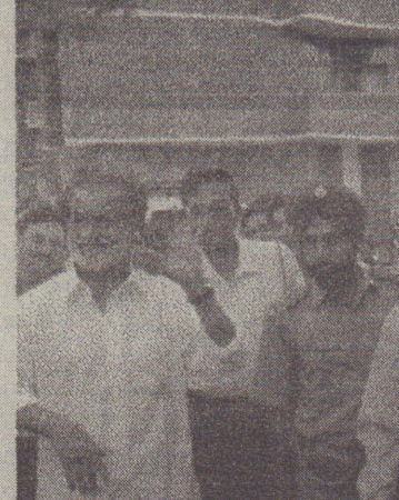
ரஜினிகாந்த் மற்ற தொகுதிகளிலும் இவ்விரு கட்சிகளுக்கு ஆதரவு தெரிவித்து உள்ளார். மதுரையில் பாக்டர் ராமதாசுக்கு

பா.ம.க. போட்டியிடும் 6 தொகுதி ரசிகர்களை ரஜினிகாந்த் சந்திக்கிறார். பாராளுமன்ற தேர்தலில் பாரதிய ஜனதா கூட்டணிக்கு நடிகர் ரஜினிகாந்த் ஆதரவு தெரிவித்து உள்ளார். பா.ம.க. போட்டியிடும் செங்கல்பட்டு, திண்டிவனம், தர்மபுரி, புதுச்சேரி, சிதம்பரம், அரக்கோணம் ஆகிய 6 தொகுதிகளிலும் அக் கட்சிக்கு எதிராக ரசிகர்கள் வெளிப்படையான பிரசாரத்தில் ஈடுபடுவார்கள் என்றும் ரஜினிகாந்த் அறிவித்து உள்ளார். ரசிகர்கள் இந்த தொகுதிகளில் அ.தி.மு.க. பாரதிய ஜனதா வேட்பாளர்களுடன் சென்று ஆதரவு திரட்டி வருகிறார்கள்.