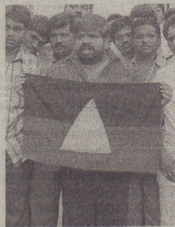
டி. ராஜேந்தர் இல்லங்களில் மங்களம் பூத்து குலங்களே இந்த நிறம். அமைதி ஆன்மீகத்தையும் இது குறிக்கும் நான் மதங்களை பார்க்கவில்லை. மனங்களை பார்க்கிறேன். நிறங்களை பார்க்கவில்லை. நெஞ்சங்களை பார்க்கிறேன். கேள்வி:- இலட்சிய தி.மு.க.வின் கொள்கை கோட்டாடுகள் என்ன?

பிரபல நடிகரும் இயக்குனருமான டி.ராஜேந்தர் தி.மு.க.வில் இருந்து விலகி அனைத்திந்திய இலட்சிய திராவிட முன்னேற்ற கழகம் என்ற பெயரில் புதிய கட்சியை தொடங்கி உள்ளார். இந்த கட்சிக்கு கறுப்பு, சிவப்பு, நடுவில் மஞ்சள் நிறத்தில் புதிய கொடியை இன்று அறிமுகம் செய்தார். சென்னை தியாகராய நகரில் உள்ள தனது வீட்டின் எதிரில் புதிய கொடியை ஏற்றி வைத்தார். ஏராளமான ரசிகர்கள் இதில் கலந்து கொண்டனர். பின்னர் டி.ராஜேந்தர் நிருபர்களிடம் கூறியதாவது:- கொடியில் உள்ள கறுப்பு சிவப்பு நிறம் அண்ணாவின் அடிப்படையிலான கொள்கையை குறிக்கும், நடுவில் உள்ள மஞ்சள் நிறத்திலான முக்கோணம் சகோதரத்துவம், மதநல்லிணக்கம், மனித நேயம் போன்றவற்றை குறிக்கும் மஞ்சள் நிறம் தமிழ்பெண்களின் மஞ்சள் குங்குமத்தின் அடையாள சின்னம் எனது தமிழர் குல