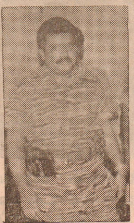
கொடிகும் சேர்த்தினம் கூடல். இன்றைய நாள் ஒரு தேசிய எழுச்சி தினம். எமது தேசம் சுதந்திரம் வேண்டி உறுதிபூணும் புரட்சி தினம். மாவீரர்களை ஒரு சந்திப்பு இவ்

அச்செய்தியில் அவர்மேலும் தெரிவித்துள்ளதாவது: இன்று மாவீரர் நாள். சுதந்திர இயக்கத்தின் சிந்த திரச் சிந்திப்பாளர் விடுதலை வீரர்களை நாம் நினைவுகூரும் நன் நாள். ஆண்டாண்டு காலமாக அடிமை நிலைக்கு முடங்கிக் கிடந்த எமது தாய் கைதை வீடுகொண்டு எரியும் விடுதலைக் களமாக மாற்றி கிட்ட வீர மறவர்களை நாம் நினைவுகொள்ளும் புனிதநாள். எமது நாடு எமக்கே சொந்த தமிழ் உரிமைக் குரலை உலகெங்கும் முழங்கச்செய்த உன்னத தியாகிகளை நாம் எமது நெஞ்சப் பசுமையில் நிறுத்திக் கொள்ளும் தேசிய நாள். மாவீரர் நாள் எமது தேச த்தின் துக்கதினம் அகில நாள் எண்ணி நினைக்க வேண்டும்