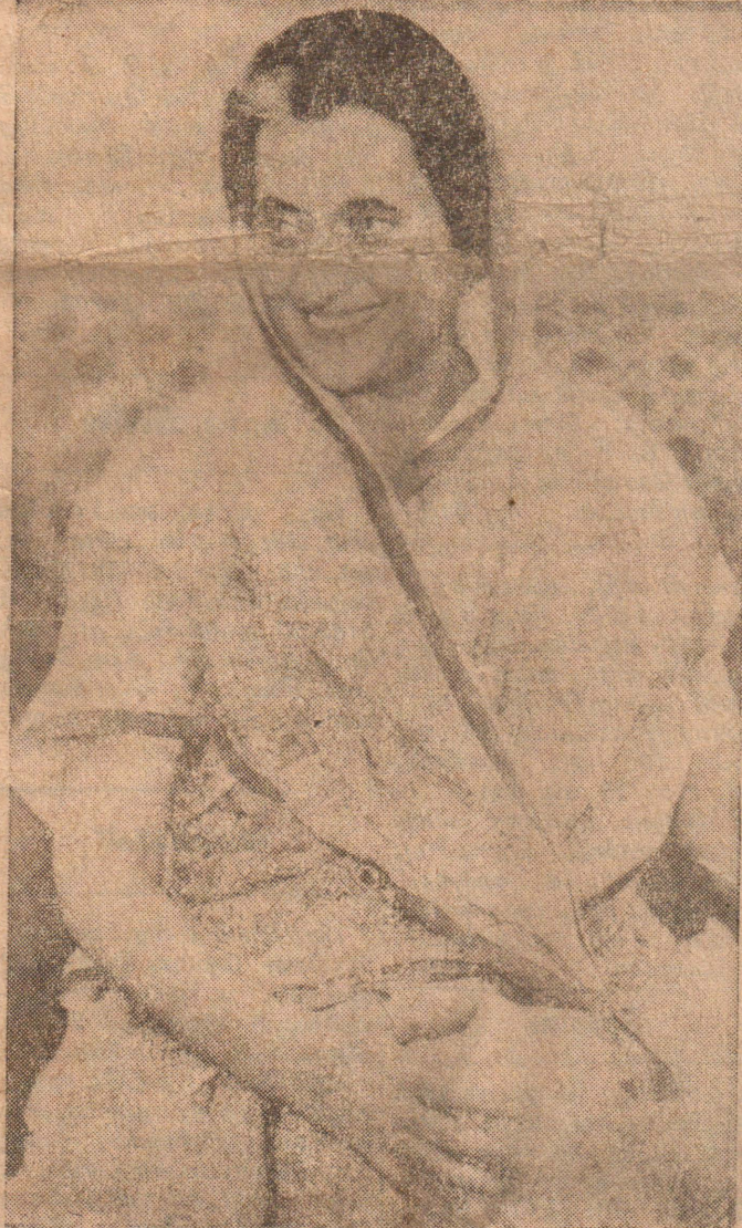
“என்பும் சதையுமாய் இத்தகையதோர் மாந்தர் இப்புலியில் வாழ்ந்தார் என்பதை நம் பின் வருவோர் நம்பவும் மறுப்பார்”

பாரதப் பிரதமரின் இறுதிச் சடங்குகளில் கலந்து கொள்வதற்காக கூட்டணித் தலைவர் (5ம் பக்கம் 5ம் கலம் பார்க்க)