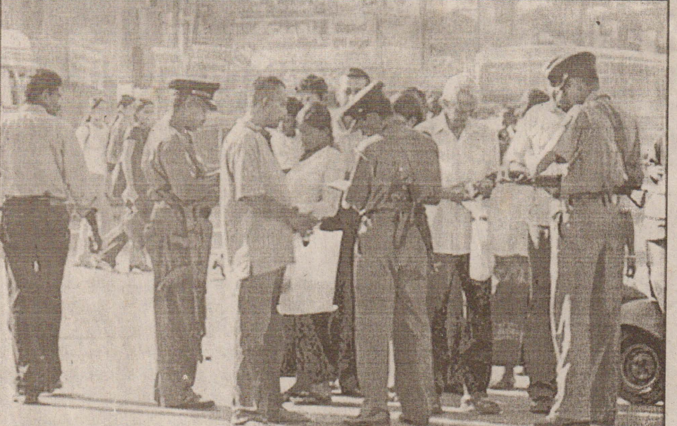
தலைநகர் கொழும்பில் வீதிச் சோதனையில் தமிழ் மக்களிடம் அடையாளத்தை பரிசோதிக்கும் பொலிஸார்....

கடந்த 3 வருடங்களாக, ஆவண உதவியாளர்களாக பணிபுரியும் ஏறக்குறைய 700க்கும் மேற்பட்ட ஊழியர்கள் அதே பதவித் தரத்தில் இருப்பதாகவும் தெரிவிக்கின்றனர். (அ-5)