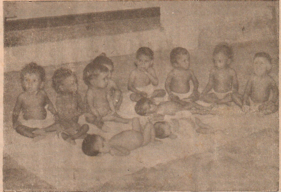
போஷாக்கின்மையால் பாதிக்கப்பட்டு தமிழர் புனர்வாழ்வு கழகத்தின் போஷாக்கு புனர்வாழ்வு நிலையத்தில் ஊட்டச்சத்து அளிக்கப்பட்டு வரும் குழந்தைகள்.

(கொழும்பு) காலியில் தமிழர்களை எரிக்கப்பட்ட சம்பவத்தை அடுத்து கொழும்பிலும் அதன் சுற்றுப்புறங்களிலும் பலத்த பாதுகாப்பு போடப்பட்டு படை யினரின் ரோந்து நடவடிக்கை தீவிரப்படுத்தப்பட்டுள்ளது. கொழும்பில் தமிழ் மக்கள் (10-ம் பக்கம் பார்க்க)