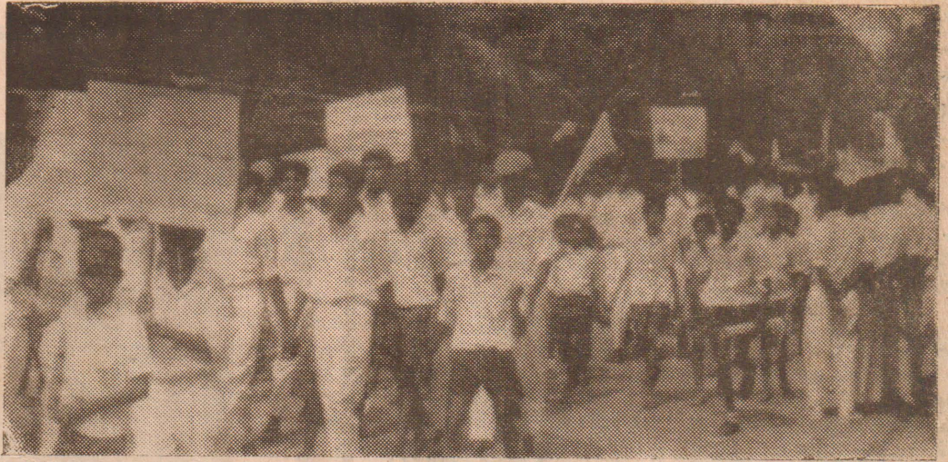
ஈரமம், ஈகமம், சீலமம், முயற்சியும் நிறைந்த வாழ்விற்காக கல்வி சுற்று ஓரே கொடியின் கீழ் எழுச்சி செய்கின்ற மாணவர் பேரணி

(நெல்லியடி) வடமராட்சி கிழக்கு குடாரப்புப் பகுதியில் சுப்பசொனிக் நடத்திய திடீர் தாக்குதலால் வயோதிக மத்துகருவர் வலது கையில் படுகாயமடைந்து மந்திடை மருத்துவமனையில் அனுமதிக்கப்பட்டுள்ளார். இச்சம்பவம் நேற்று முன்தினம் மாலை 6.30 மணியளவில் இடம்பெற்றது. பேரரச்சலுடன் வந்த சுப்பசொனிக் குடாரப்பு பகுதி (10-ம் பக்கம் பார்க்க)