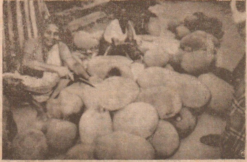
தமிழீழம் இயற்கைவளம் கொண்டது. உணவுத் தேவையைப் பொறுத்தளவில் தன் நிறைவுகொண்டது. காலத்துக்குக் காலம் மா, வாழை, பலா கனிவகைகளும் தேவையைப் பூர்த்திசெய்கின்றன. தற்போது வடதமிழீழத்தில் பலாப்பழக்காலம் பழங்கள் தாராளமாக சகலருக்கும் கிடைக்கும் வகையில் சந்தைக்கு வருகின்றன.

(மட்டக்களப்பு) மட்டக்களப்பில் திகில வெட்டைப் பகுதியில் மாட்டு வண்டியில் சென்றுகொண்டிருந்த தமிழ் குடும்பமொன்றை நோக்கி படைத்தளபினர் துப்பாக்கிச் சூட்டை நிகழ்த்தினர். இத்தாக்குதலினால் வண்டியில் வந்துகொண்டிருந்த அனைவரும் படுகாயமடைந்தனர். இதேவேளை துறைநல்லாவணியில் இராணுவத்தினர் மேற்கொண்ட துப்பாக்கிப் பிரயோகத்தினால் பாடசாலை அதிபரான வேதநாயகம் என்பவர் பலியானார். (சி-சி-ரி)