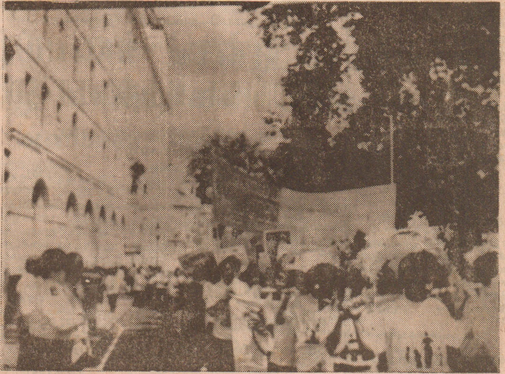
லண்டன் ரூட்டிங் மாநகரில் அண்மையில் விடுதலைப்புலிகளும் லண்டன் வாழ் தமிழ் மக்களும் இணைந்து, தமிழீழ கோரிக்கையை முன்வைத்தும், தமிழீழ மக்கள் மீதான இராணுவ வன்முறைகளைக் கண்டித்தும் நடாத்திய ஆர்ப்பாட்டப் டேரணியின் ஒரு பகுதியை படத்தில் காணலாம்.

யாழ். மாவட்டம் முழுவ தும் ஒன்பது ஆயிரத்துக்கு (7ம் பக்கம் பார்க்க)