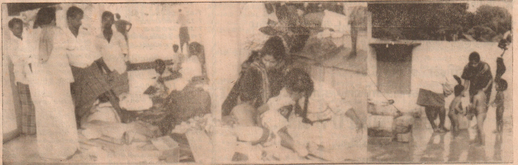
யாழ்ப்பாணம் அழைத்து வரப்பட்ட 'ஐரிஸ் மோனா' பயணிகள் ஜோன்பொஸ்கோ பாடசாலையில் தங்க வைக்கப்பட்டிருப்பதை படத்தில் காணலாம்.

துறையைச் சேர்ந்த பொலிசார் பலர் முற்றுகையிட்டதாக பி.பி.சி. சங்களைச் சேவை தெரிவித்தது. (5-ம் பக்கம் பார்க்க)