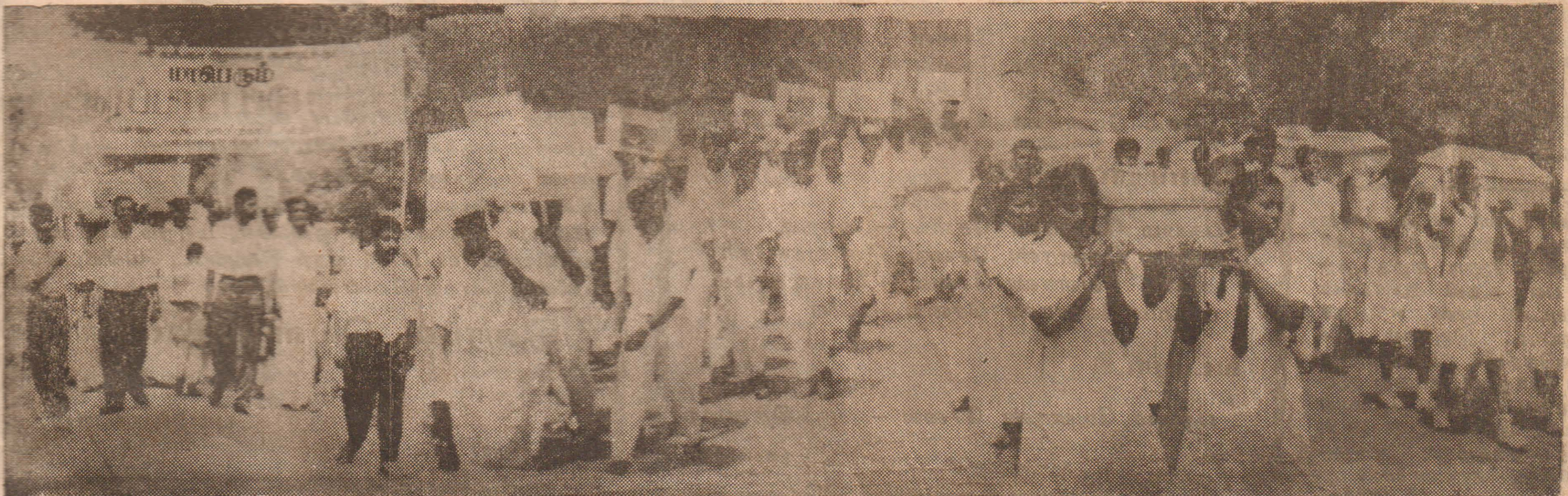
யாழ். நகரில் நேற்று நடைபெற்ற ஆர்ப்பாட்டப் பேரணியில் கலந்துகொண்டவர்களில் வெகுஜன அமைப்பு ஒன்றிய முக்கியஸ்தர் களும், குண்டு வீச்சில் பலியான பாதிக்கப்பட்ட மாணவர்களின் படங்களையும் பிரேத பேழைகளையும் தாங்கிவரும் மாணவ மாணவிகளையும் படங்களில் காணலாம்.

கோவிலில் மாணவர் கொலை, தமிழர்கள் உயிருக்கு இனையா வினை, மாணவ ரைக் கொடுவதாக மண்டியி டாத தமிழீழம், புலிகளை கண் டாகி ஒடுகருய், பன்னியிற் (6ம் பக்கம் பார்க்க)