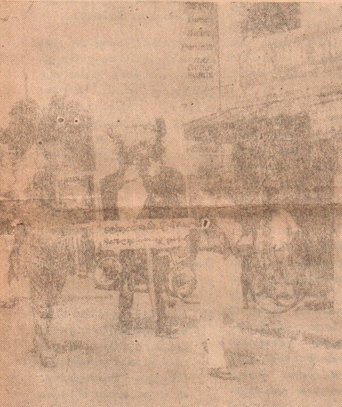
தின் மே தின ஊர்வலம் - 1988

மையில் வரலாற்று எதிர்ப்பு மிக்கவை. உலக முதலாளித்துவத்தினால் இலங்கை முதலாளித்துவம் வகிக்கும் ஸ்தானத்தினாலும், அந்த உலக முதலாளித்துவத்தின் வரலாற்று முரண்பாடுகளினாலும் நிர்ணயம் செய்யப்பட்டுள்ள இலங்கையின் முதலாளித்துவத்தின் நெருக்கடியைத் தீர்க்கும் 'தேசிய பாதைகள்' இலங்கை அவர்களின் இந்த 'தேசிய பாதை' யானது தொழிலாள வர்க்கத்தை 'தேசிய முதலாளி வர்க்கத்துக்கு' அடிமைப்படுத்தி அதன் மூலம் ஏகாதிபத்தியத்தினதும் தேசிய முதலாளி வர்க்கத்தினதும் எதர்ப்புரட்சி வேலைத் திட்டத்துக்கு பலியிடும் வேலைத் திட்டமாக விளங்குகின்றது.