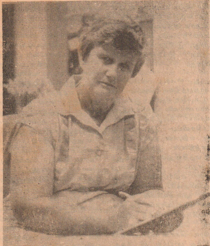
செனட்டர் ஒல்வ் சகாரோவ்