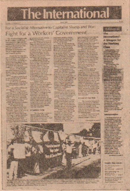
கனடிய ட்ரொட்ஸ்கிஸ்டுகளின் இரு மொழிப் பத்திரிகை.

இக்கருத்துக் கணிப்புத் தொடர்பாக அ. தொ. க. வெளியிட்ட அறிக்கை கூறுவதாவது: “நாம் இந்த அரசியலமைப்புச் சட்டத் திருத்தங்களைத் தோற்கடிக்கப் போராடுகின்றோம். முதலாளி வர்க்கமோ அல்லது அதன் எந்தவொரு பிரிவோ அதன் ஆட்சியை மறுசீரமைக்கவும் உறுதிப்படுத்தவும் செய்யும் அனைத்து முயற்சிகளையும் நாம் எதிர்க்கின்றோம். தொழிலாளி வர்க்கம் ஒரு சுயாதீனமான வர்க்கமாகச் செயற்படக் கற்றுக் கொள்ளும் போது மட்டுமே அதனால் சமூக நெருக்கடியைத் தீர்ப்பதற்கு தொழிலாளி வர்க்கத்துக்கு அவசியப்படும் தீர்வினை முன்வைக்க முடியும். எனவே கனடாவில் இருந்து குவிபெக்கை பிரித்து வட அமெரிக்கக் கண்டத்தில் ஒரு மூன்றாவது ஏகாதிபத்திய அரசினை அமைக்க இடம் பெறும் இந்தக் கருத்துக் கணிப்பு வாக்கெடுப்பில் தொழி