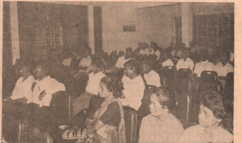
கண்டி. பொதுக் கூட்டத்துக்கு வருகை தந்தோரில் ஒரு பகுதியினர்.

கூட்டத்திற்கு வருகை தந்த 24 தொழிலாளர்களும், இளை