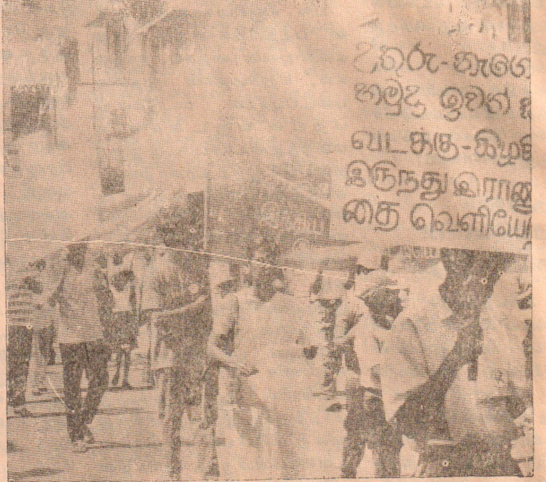
வடக்கு-கிழக்கில் இருந்து இராணுவத்தை வெளியேற்றக் கோரும் புரட்சிக் கம்யூனிஸ்ட் கழக ஊர்வலம்.

1972ல் அமுலுக்கு வந்த இனவாத 'தரப்படுத்தலின்' சிருஷ்டி கர்த்தாக்கள் இன்றைய பொதுஜன முன்னணி அரசாங்கத்தின் முன்னோடிகளேயாவர். அன்றைய கட்டத்தில் சி.ல.ச.க-சமசமாஜ-கப்பூனிஸ்ட் கூட்டரசாங்கம் இந்த தரப்படுத்தல் முறை 'வசதிவாய்ப்புக்களற்ற மாணவர்களை வசதிவாய்ப்புக்கள் நிறைந்த மாணவர்களின், (யாழ்ப்பாணம்) தரத்துக்கு கொணரவே அமுலுக்கு கொணரப்பட்டதாக வாதிட்டது இந்த பிற்போக்கு வாதத்தினை அம்பலப்படுத்தும் விதத்தில் "பாதிக்கப்