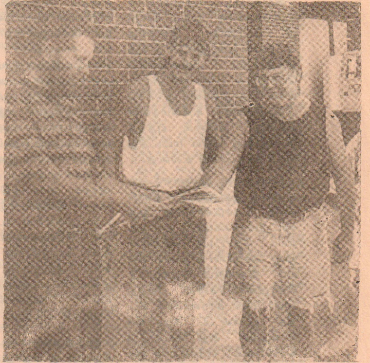
அமெரிக்க பட்டில் கிறீக் தொழிற்சாலையில் கேலொக் தொழிலாளர்கள்

இப் பிரச்சினை தொழிலாளர் இயக்கத்தின் தலைமையினதும் மூலோபாயத்தினதும் நெருக்கடியை எடுத்துக் காட்டியுள்ளது. தொழிற் சங்கங்களும் பழைய தொழிலாளர் அமைப்புகளும் மூலதனத்