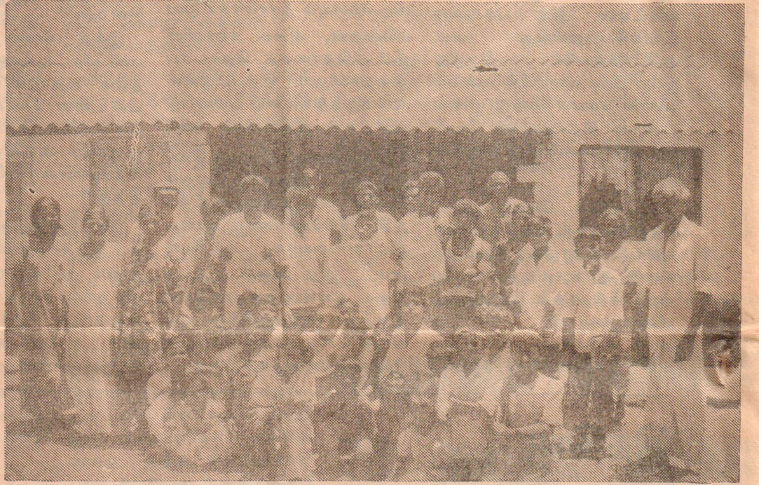
வெலிஓபா தோட்டத்தில் வேலைநிறுத்தம் செய்த தொழிலாளர்.

அரசாங்கம் தனது இனவாத கூச்சல்களினால் மக்களின் கண்களில் மண் போடுவதன் மூலம் இந்த மக்கள் விரோத நடவடிக்கைகளை ஒன்றன் பின் ஒன்றாக அமுல் செய்யத் துடித்து வருகின்றது. அரசியல் தீர்வு யோசனைகள் எனப்படுபவற்றை முன்வைப்பதன் மூலம் அரசாங்க யுத்த பேரிகைகளுக்கு இனவாதக் கும்பல்களையும் பாசிச குண்டர்களையும் முதலாளித்துவ வெகுஜனத் தொடர்புச் சாதனங்களையும் ஈடுபடுத்திக் கொண்டுள்ளது. அமெரிக்கா தொடக்கம் பிரித்தானியா வரையிலான ஏகாதிபத்திய சக்திகள்