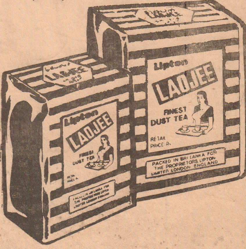
லிப்டன் லாவோஜி அதிசிறந்த தேயிலைத் தூள்.

லிப்டன் சிலோன் லிமிட்டெட், த. பெ. எண் 86, கொழும்பு.