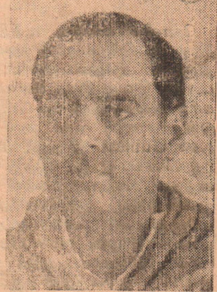
காணப்பட வேண்டியதன் அவ சியத்தை வலுவாக வலியுறுத் தியதாகவும் தெரியவருகிறது.