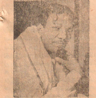
முன்னேற்றக் கழகத் தலைவர் கலைஞர் மு. கருணாநிதியும் கலந்து கொண்ட ஹிந்தித்திணிப்பு எதிர்ப்பு தொடர்பான மாநாட்டில் மத்திய அரசிடம்

இவ்விழாவில் தற்போது பாகிஸ்தானில் உள்ள எல்லை காந்தி கபார்காவும் கலந்து கொள்கிறார்.