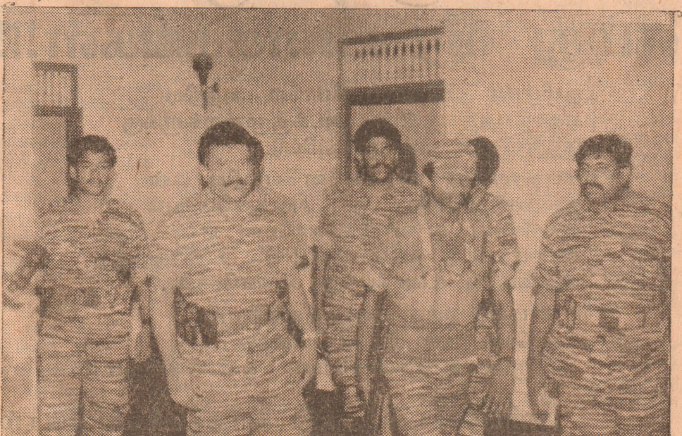
(காரியாலயத்தில்) விடுதலைப் புலிகள்

தமிழ் விடுதலைப் புலிகள் தலைப்புலிகள் காரியாலயத்தில் பற்றி விளக்கம் அளிக்கையில் தலைவர் திரு. வே. பிரபாகரன், பத்திரிகையாளர் மத்தியில், மேற்கண்டவாறு தெரிவித்த நேற்றுக் காலை, நல்லூர் விடுதலைப் புலிகள் நிலைப்பாடு தார்.