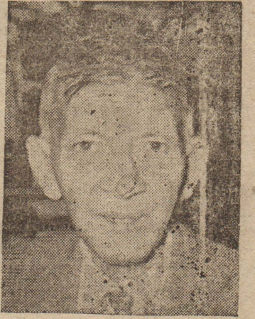
அரசு கௌரவித்து நடைமுறைப்படுத்தவில்லை.

திரு. செல்வநாயகம் தமிழ்தேசிய இயக்கத்தின் தலைமையை ஏற்க விரும்பாமற் றே என்பதற்கு முன்பு சான்றாக நான் அறிந்திருக்கிறேன் -