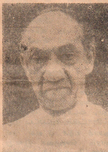
ஜயவர்தனா — காந்தி கூட்டுச் சதியான இந்திய — இலங்கை ஒப்பந்தத்தின் பின்னால் மத்தியவாதிகள் ஒடுகின்றனர்.

எங்ஙனமாயினும் அத்தேவையை நிறைவேற்றி விட முடியாது இருந்தது. வடக்கு — கிழக்கு ஆயுத விடுதலைப் போராட்டம் எழுச்சியுற்றமை யூ. என். பி. அரசாங்கத்தை