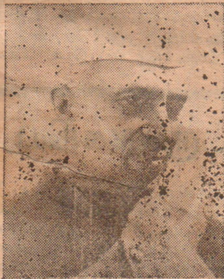
போன்ற நாட்டில் வாழும் தனிநபர்கள் துணிச்சலுடன் பயங்கரமான போராட்டமுறையில் இறங்குகிறார்கள். இத்தகைய தனி

சௌதரி: நீதிமன்றங்களில் புரட்சிக்காரர்கள் சார்