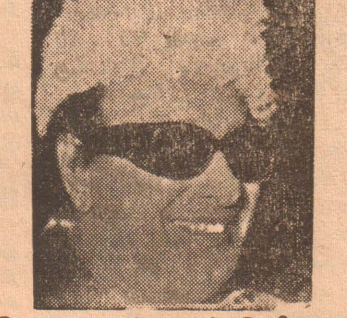
பொங்கல் திருநாள் இனிதாக அமைய வழித்துகிறேன்."

என்று தமிழ்நாடு முதலமைச்சர் திரு. எம். ஜி. இராமச்சந்திரன் நியூயோர்க் புறாக்கின் மருத்துவமனையிலிருந்து விடுத்தள்ள பொங்கல் வாழ்த்துச் செய்தியில் தெரிவித்திருக்கிறார்.