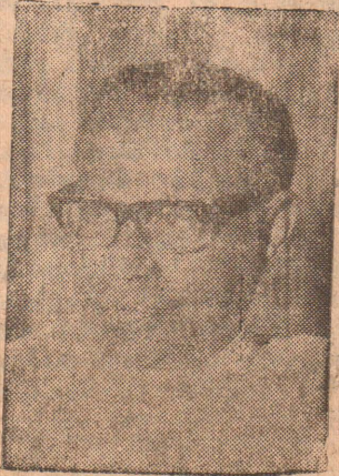
மனோ ஆகிய ப... ளில் குடியேறிய சுமார் இருபதுயிரம் இந்திய வம்சாவழியினர் அங்கிருந்து துப்பாக்கி முனையில் வெளியேற்றப்பட்டனர்.

இலங்கையின் இடைபிரச்சினை தொடர்பாகவும், தமிழ் மக்கள் அடைந்துவரும் இன்னல்கள் பற்றியும் இலங்கை தொழிலாளர் காங்கிரஸ் மிக முக்கியமான சில முடிவுகளை இன்று எடுக்கவுள்ளது. "நாம் என்ன முடிவை எடுப்போம் என்பது இன்று பிற்பகல் தெரந்துவிடும்" என்று தொழிலாளர் காங்கிரஸ் தலைவரும், கிராமிய கைத் தொழில் அமைச்சருமான திரு. எஸ். தொண்டமான் நேற்றிரவு ஈழ முரசுக்கு தெரிவித்தார். இன்றைய கூட்டம் இந்த முடிவை எடுக்கும்.