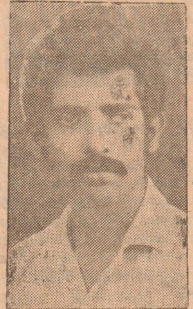
பிரபலம் பெற்ற விளங்கிய துள்ளிசை (போப்) ப் பாடல் களின் துயில்வதையும் ஒப் பிட்டு நோக்கக் கூடியதாக உள்ளது.

ஏனெனில் புகழ் பெற்ற "ஒ ஷீலா..." மிஸ்சா... மிஸ்ஸா... "அடுத்த விட் டுக் கல்யாணிக்குக் கல்யா ணம்..." போன்ற துள்ளி