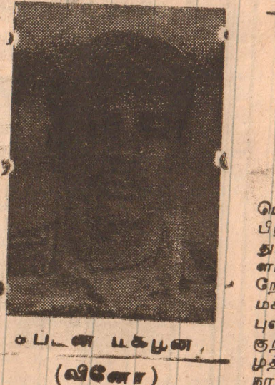
புலோப்பளைப் பகுதியில் (வினோ) 2-ம் லெப. காவேரி