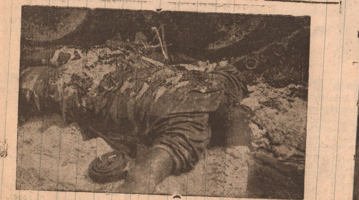
புலோப்பளையில் விடுதலைப் புலிகளால் அழிக்கப்பட்ட டாங்கியின் அடக்கில் சிறிலங்கா இராணுவ சிப்பாய் ஒருவரின் சடலத்தை படத்தில் காணலாம்

யோரே படுகாயமடைந்த நிலையில் பருத்தித்துறை வைத்தியசாலைக்கு எடுத்து வரப்பட்டனர். வல்வெட்டித்துறையில் மாலை 5.30 மணிக்கு மேற்கொண்ட இத்தாக்குதலில் வல்வெட்டித்துறையைச் சேர்ந்தவர்களே பாதிப்படைந்தனர். (போ)