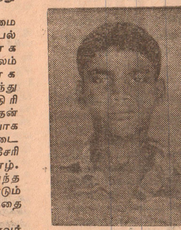
வீரவேங்கை இசையாளன் / சமன்

பாடசாலை மாணவர்கள், மற்றும் பாதிக்கப்பட்ட மாணவர்களின் பெற்றோர் கலந்து கொள்ளவுள்ளனர். எதிர்வரும் வியாழக்கிழமை கலை 9 மணிக்கு யாழ். பல்கலைக் கழகம் முன்பாக ஆரம்பமாகும் இவ் ஊர்வலம் சிவன்கோவில் வீதியூடாக கோவில் வீதியை அடைந்து அதன் வழியே ஆஸ்பத்திரி வீதியை வந்தடைந்து அதன் வழியாக கண்டி வீதி வழியாக யாழ். செயலகத்தை வந்தடையும் அங்கிருந்து கச்சேரி நல்லூர் வீதி வழியாக யாழ். கல்வித்திணைக்கழகத்தை வந்தடைந்து அங்கிருந்து மீண்டும் யாழ். பல்கலைக் கழகத்தை சென்றடையவுள்ளது.