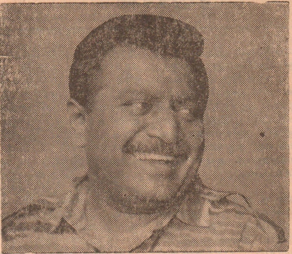
காலகட்டத்தில் இங்கு வந்த இந்தியப் படை வழிதவறி, சிங்களச் சதிக்கு இரையானது பற்றி அப்போரை நிறுத்த மேற்கொண்ட முயற்சிகள் பற்றிய தகவல்களைக் கொண்டுள்ளது, ஆனால் இவற்றிலெல்லாம் முக்கியமானதாக, மூன்றாம் காலகட்டப்பகுதி அமைகின்றது. முன்னிரு கட்டங்களை விட வேறுபட்டதாக தலைவரின் தன்னுணர்வுகளை, பட்டினிவீண் பண்பினை, பல விடயங்கள் பற்றி அவாவி நிற்கும் அவரது ஆவல்களை, ஒரு பெரும் போரை நடாத்தும் அதேசமயம் தமிழ்மக்களின் பல்புற சார் வளர்ச்சிக்காக தமிழீழ தேசத்தின் கட்டுக்கோப்பான எதிர்கால விருத்திக்கான அவரது எண்ணப்பாங்குகளை அறிய முடிகின்றது.

வெளிக்காட்டியமை - அதே போல 86-ம் ஆண்டு நியூஸ் வீக் செவ்வியல் 'நான் தனிப்பட்ட முறையில் சொந்த முயற்சியில் பயிற்சிபெற்றேன். நான் எனது இயல்பான திறனாற்றல் மூலமே செயற்படுகிறேன்' என்றமை - அதே செவ்வியல் இந்திய இராணுவத் தலையீடு அனாவசியம் என திட்டவாட்டமாகக் கூறியமை, இங்கு குறிப்பிடட்டுக்காட்ட வேண்டியவை. அது போலவே புகழ்பெற்ற 1987 யூலை சுதமலைப் பேச்சின் போது 'சிங்கள இனவாதப் பூதம் இல. - இந்திய ஒப்பந்தத்தை விரைவில் விழுங்கிவிடும் காலம் வெகுதூரத்தில் இல்லை' என்றமையில் எங்கும் எல்லாச் செவ்விகளிலும் அறிக்கைகளிலும் அடிநாதமாக, தமிழீழ இலட்சியத்தை மேன்மைப்படுத்தும் இயல்பினைக் காணமுடியும். இவற்றினை எல்லாம் விட 1986 செப்டெம்பர் மாத இந்து செய்தித்தாளில் வெளிவந்து மிக்கபரபரப்பை ஊட்டிய தலைவரது பேட்டியின் இறுதியில் 'என் இயல்பான போக்கையும் சொல்கிறேன் - உண்மையான அரசியலில் நான் எப்போதும் பேச்சுக்கு தருவது குறைந்தளவு முக்கியத்துவமே, செயலால் வளர்ந்த பின்பு தான் நாம் பேசத் தொடங்குவது வேண்டும்... சொல்லுக்கு முன்பே எப்போதும் செயல்' ஆருக்க வேண்டும். இச்செயல்தான் எம்மையும் மக்களையும் இறுசப்பிணைத்தது. இராணுவம் உங்களை தாக்கவருகிறது - நான்கள் எதிர்த்து தாக்குவோம். உங்களை பாதுகாப்போம் என்று நாம் சொன்னால் - சொன்னதை செயல்படுத்தும் போதுதான் மக்கள் எம்மீது