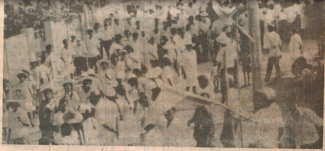
நேற்று யாழ்ப்பாணம் நகரில் நடைபெற்ற மேதினப் பேரணியில் கலந்துகொண்ட மக்களின் ஒரு பகுதியினர்.

மாவட்டரீதியில் யாழ்ப்பாணம் செயலகத்தினால் நடாத்தப்பட்ட மாபெரும் "ஹாக்கி" இறுதியாட்டத்தில் கிராஸ் கொப்பேர்ஸ் அணியை எதிர்ந்து விளையாடிய யாழ்ப்பாணம் கலைக்கழக அணி 1-2 என்ற கோல் கணக்கினால் வெற்றிபெற்றுள்ளது.