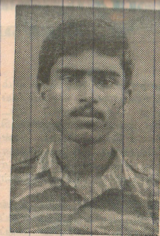
கப். திலீபன் (தொல்காப்பியன்)

மாதாந்த ரிடமிருந்து ரூபா 10 ம் தனியார் வியாபாரக் கணக்குகளை வைத்திருப்போரிடமிருந்து ரூபா 25 ம், வியாபாரக் கணக்குகளை வைத்திருப்போரிடமிருந்து ரூபா 50 ம், கூட்டுத்தாபனக் கணக்குகளை வைத்திருப்போரிடமிருந்து ரூபா 50 ம், இம் மீதிகளைப் பேணாதோரிடமிருந்து சேவைக்கட்டணம் அறவிடப்பட உள்ளதாகவும் தெரிவிக்கப்பட்டுள்ளது. (17)