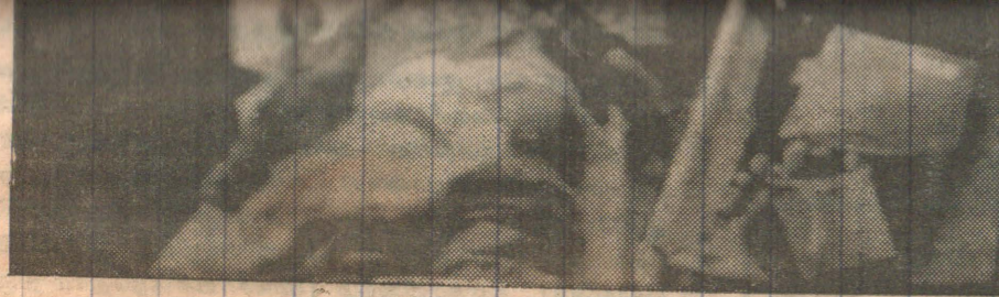
ஜனாதிபதி பிரேமதாசாவுடன் நேற்று முன்தினம் கொல்லப்பட்ட சிலரின் சடலங்களை படத்தில் காணலாம்.