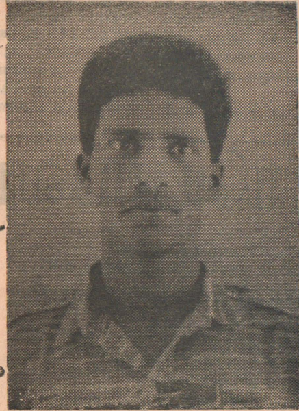
கம்பன் புரவலன் (சசாங்கன்) வெள்ளைக்குட்டி பூபாலப்பிள்ளை தம்பலவத்தை, மண்டூர், மட்டக்களப்பு.

16-12-1992 அன்று யாழ். மாவட்டத்தின் கிளாலிக் கடற்பரப்பில் சிறிலங்கா கடற்படையினருடனான நேரடி மோதலின் போது வீரச்சாவடைந்த வீரவேங்கைகள்