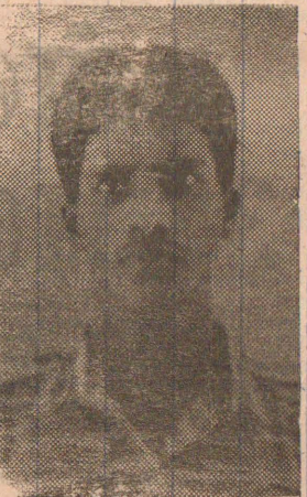
கப்டன் புரவலன் [சசாங்கன்]