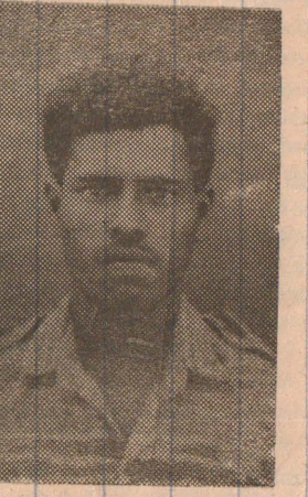
கடற்புலி லெப்டினன்ட் வெற்றி