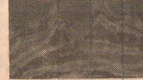
கடற்புலி கப்டன் அறிவழகன் (சாஜகான்)