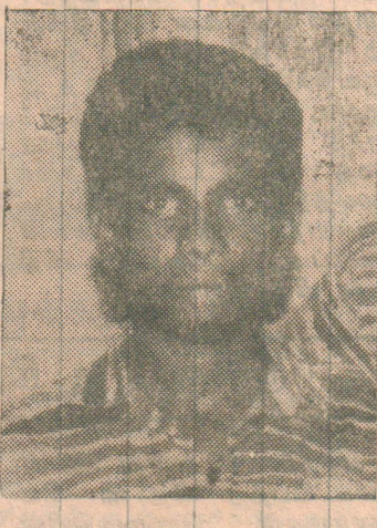
கரும்புலி கப்டன் சிதம்பரம்

இன்று எமது மண்ணில் கடற்புலிகள் அமைப்பு வளர்ச்சியடைந்து விட்டது. இவனைப் போன்ற மாவீரர்களின் உழைப்பினாலும், (4 ஆம் பக்கம் பார்க்க)