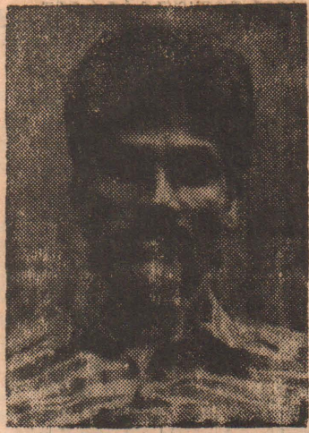
மணலாறு மாவட்ட விசேட தளபதி அன்பு

இழப்பதற்கு இனி எதுவுமில்லை என்ற நிலையிலுள்ள மணலாறு எல்லைக் கிராமங்கள். இம் மக்களின் நிலையும் அதுதான். ஆனால் இழப்புகளை நிரந்தரமாக்க அவர்களுக்கு தயாராக இல்லை. தாம் இழந்த மண்ணை, இழந்த பொருள்களை மீட்ட வேண்டும் என்பதே அவர்களின் கிராமங்களை இன்று அவர்களிடம் காணப்படும் உறுதி. எண்பதுகளின் ஆரம்பத்தில் பயிற்சியின் ஆயுதமேந்தி வீரத்துடன் செயல்பட்ட மக்கள், தொண்ணூறில் ஆரம்பத்தில்