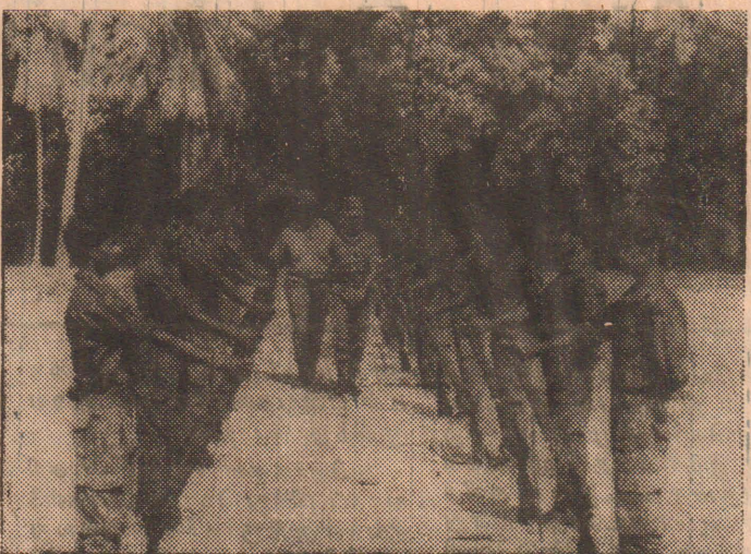
விசேட தளபதி அன்பு துணைப்படை அணிவகுப்பை ஏற்கிறார்.

துணைப்படையினருக்கு சிறந்த முறையில் பயிற்சி வழங்கிய துணைப்படைப் பொறுப்பாளர் டாக்டர் அவர்களுக்கு அன்பு பாராட்டுதல்களையும் வழங்கினார்.