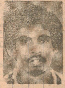
கரும்புலி கப்டன் மில்லர்

சிறிலங்காப் படைகளின் முகாம். முத்துக்கள் விணையும் மன்னார்க்க கடலின் அருகே இருக்கும் இந்த முகாம் மீதான தாக்குதல் தமிழீழ உரணத்தில் முதலாவது பெரும் போர் எனக் குறிப்பிடலாம். சிறிலங்காவின் முப்படைகளையும் எதிர்த்து தமிழீழத்தின் வீரப்புலி மறவர்கள் நடத்திய தீரம் மிகும் போர் இது வடக்கே தன்னாடி, வங்காள இராணுவ முகாம்களிலிருந்தும் தெற்கே கொண்டச்சி முகாமிலிருந்தும் மேற்கே கடலிலிருந்தும், வான்மாரீக்மாவையும் தாக்குதல் நடத்திய படைகளினால்