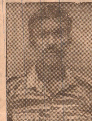
கப்டன், பாவாணன் (கெனடி)