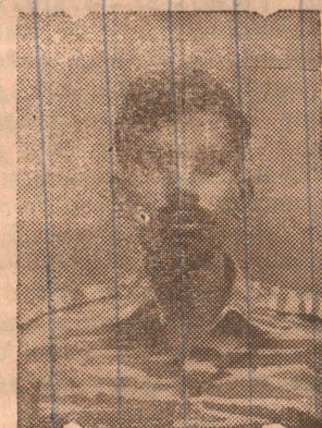
லெப், புகழேந்தி (லம்பா)