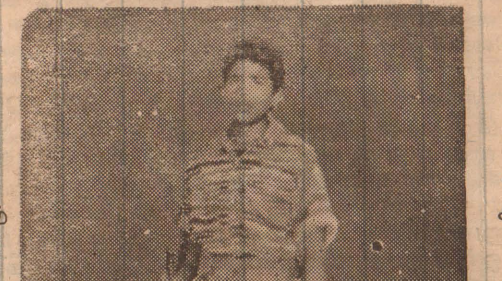
வீர ஜனனம் 1