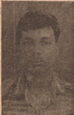
செல் தமிழகக் கல் தேக்கு விதை சண்முகம்