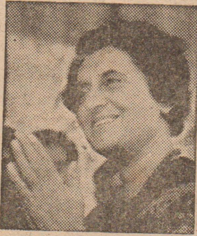
பேச்சுவார்த்தை நடத்தும் பொருட்டு அங்கு இந்திய வெளிப்புற அமைச்சர் செல்வவுள்ளார். (வெ)