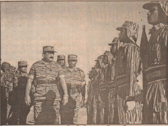
பயிற்சி நிறைவு நிகழ்வில்...