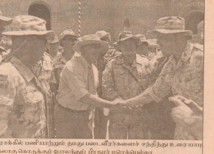
ஈராக்கில் பணியாற்றும் தமது படைவீரர்களைச் சந்தித்து உரையாடகைகொடுக்கொடுக்கும் யோலந்தும் பிரதமர் மரெக்வெல்கா

-பயங்கரவாதத் தாக்குதல் என்கிறது பொலிஸ் துருக்கிய தலைநகரில் அமைந்துள்ள இரு ஹோட்டல்களில் நேற்று அதிகாலை இடம் பெற்ற குண்டு வெடிப்புச் சம்பவத்தில் ஒருவர் கொல்லப்பட்டதாகவும், எட்டுப் பேர் காயமடைந்துள்ளதாகவும் தெரிகிறது. இச்சம்பவம் ஒரு பயங்கரவாதத் தாக்குதலாகத் தெரிகிறது என்று துருக்கியின் பொலிஸ்துறைத் தலைவர் தெரிவித்துள்ளார். ஹோட்டல் குண்டு வெடிப்புகளைத் தொடர்ந்து தலைநகரான இஸ்தான்புலம் நகருக்கு வெளியே அமைந்துள்ள எரிவாயுக் களஞ்சிய சாலையிலும் குண்டுகள் வெடித்துள்ளதாகவும் இதன் போது எவரும் காயமடையவில்லை என்றும் தெரிவிக்கப்படுகின்றது.