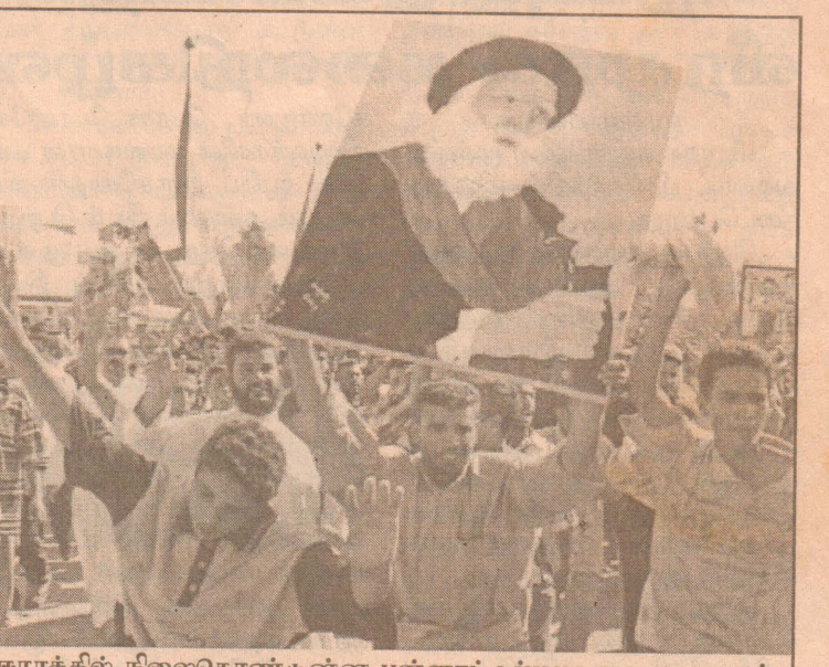
ஈராக்கில் நிலைகொண்டுள்ள பன்னாட்டுப்படைகளை வாபஸ் பெறுமாறு கோரி பஸ்ரா நகரில் ஆர்ப்பாட்டம் பேரணி நடத்தும் சியா முஸ்லிம் ஆதரவாளர்கள்.