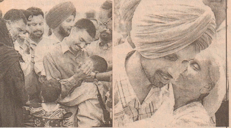
பாகிஸ்தானால் நேற்று முன்தினம் விடுவிக்கப்பட்ட இரண்டு இந்திய இராணுவ வீரர்கள் தத்தமது குடும்பத்தினருடன் இணைந்து கொள்கின்றனர்.

உத்தரப்பிரதேசத்தில் வாரணாசியில் தடையை மீறி காசி விசுவநாதர் கோயிலுக்கு ஜலஅபிஷேகம் செய்வதற்காகச் சென்ற சீவசேனையைச் சேர்ந்த 250 தொண்டர்களைத் திங்கட்கிழமை பொலிசார் கைது செய்தனர். வாரணாசியில் ஞானவாபி மருதி அருகே அமைந்துள்ளது. காசி விசுவநாதர், சிருங்கார கௌரி கோயில் திங்கட்கிழமையான நேற்று முன்தினம் ஊர்வலமாகச் சென்று அந்தக் கோயில் ஜல அபிஷேகம் செய்யும் மாவட்ட சீவசேனை தொண்டர்கள் அறிவித்திருந்தனர். ஊர்வலமாகச் செல்லவும், கூட்டமாக ஜல அபிஷேகம் செய்யப் போவதாக நிர்வாகம் தடை விதித்தது. பலத்த பாதுகாப்பு ஏற்பாடுகள் செய்யப்பட்டிருந்தன. தடையை மீறிய சீவசேனைத் தொண்டர்களை பொலிசார் கைது செய்தனர். இதனிடையே கோயிலில் பக்தர்கள் தனித்தனியாகச் சென்று ஜல அபிஷேகம் செய்வது தடையின்றி நடைபெற்றது என்றும் அதிகார வட்டாரங்கள் தெரிவித்தன.