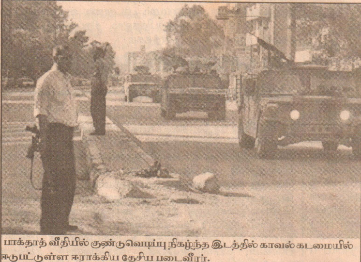
பாக்தாத் வீதியில் குண்டு வெடிப்பு நிகழ்ந்த இடத்தில் காவல் கடமையில் ஈடுபட்டுள்ள ஈராக்கிய தேசிய படைவீரர்.

ரிக்க ஒன்றியத்தின் யோசனைகளை அந்நாட்டு அரசாங்கம் நிராகரித்துள்ளது.