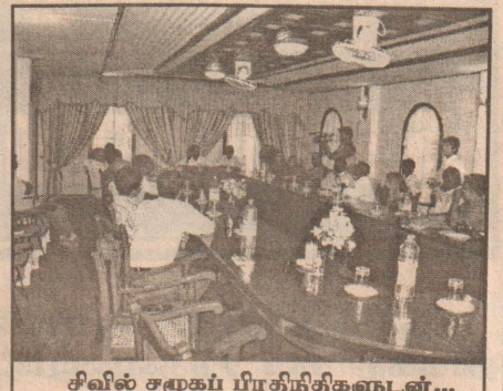
சிவில் சமூகப் பிரதிநிதிகளுடன்...

சமூகத்தின் பிரதிநிதிகளுக்கு வலியுறுத்தினார்.