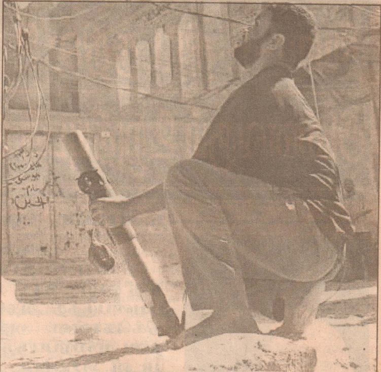
ஈராக்கில் மக்டடா அல்சதார் ஆதரவுப் போராளியொருவர் நஜாப் நகரில் முகாம் ஒன்றிலிருந்து மோட்டார் எறிகணை ஒன்றை செலுத்துகிறார்.

பதற்கு முன்னால் காலணித்துவ சக்தியான பிரிட்டன் முயற்சி செய்கிறது. உள்நாடு வெளிநாட்டு எதிரிகள் காணிச்சலீகரிப்பு விவகாரம் தொடர்பாக சிம்பாவேயின் பொருளாதாரத்தை சீர்குலைத்துள்ளனர். என்றும் சனாதிபதி முகாபே குற்றம் சாட்டியுள்ளார்.