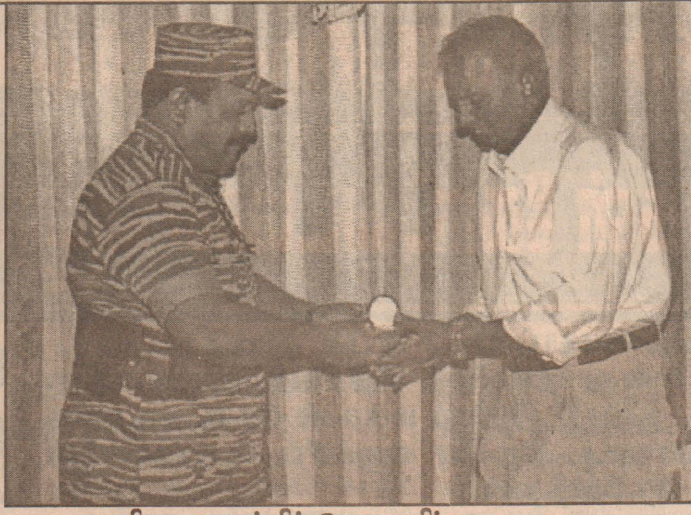
விருது வழங்கிக் கௌரவிப்பு

02. பட்டதாரிகள் நியமனத்தில் இடம் பெற்ற முறைகேடுகளைக் கண்டித்து யாழ்.மாவட்ட வேலையற்ற பட்டதாரிகள் சங்கம் யாழ். செயலகம் முன் அடையாள மறியற் போராட்டம் ஒன்றில் ஈடுபட்டனர்.