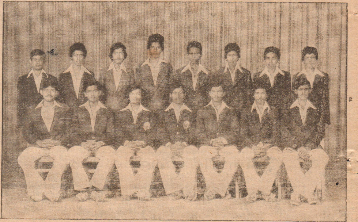
யாழ். மத்திய கல்லூரி கோஷ்டி