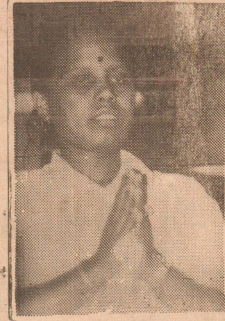
5 வருடமானசிக நோயினால் சுகம்பெற்ற சகோதரி