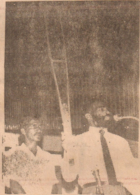
18.03.90 சுகத தாச விளையாட்டரங்கில் நடைபெற்ற கவிஞ்சு கூட்டத்தின் போது ஊன்று கோலுடன் வந்த ஒரு சகோதரன் ஊன்று கோலை விட்டு நடந்து வந்து காட்சி கொடுத்து, ஊன்று கோலை ஆலயத்துக்கே கொடுத்து விட்டார்.