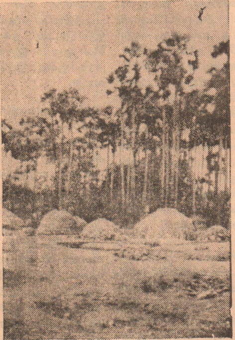
கந்தரோடையில் பௌத்த அடையாளங்கள்

காணப்பட்டாலும், சாத்தனார் எழுதிய தமிழ் பௌத்த காவியமான 'மணிமேகலை' முக்கிய இடம் பெறுகிறது. அத்துடன் வீரசோழியம், குண்டலகேசி, நீலகேசி, பிப்பிசாரங்கதை போன்ற பௌத்த நூல்களும் இங்கு குறிப்பிடத்தக்கவை. இது தமிழர்கள் பௌத்தர்களாகவும் இருந்தனர் என்பதற்குச் சிறந்த எடுத்துக்காட்டுகளாகும்.