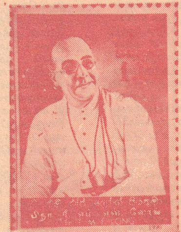
வர் ஊர்வலம் கல்லூரிவரை நடைபெற்றது. இந் நிகழ்ச்சியில் பிரதம விருந்தினராக யாழ். ஆயர்