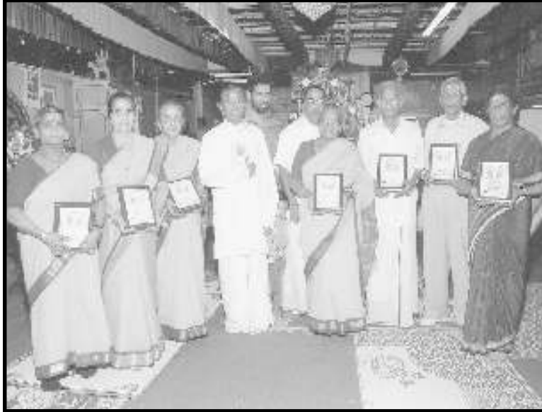
திருவாசகம் முற்றோதலுக்கு ஒழுங்காக வரவு தந்தமைக்காக கேடயம் பெற்றவர்கள்