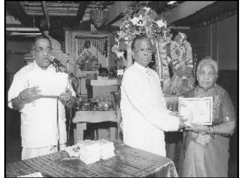
திருவெம்பாவை காலத்தில் திருவாசகம் முற்றோதலில் பங்குபற்றியமைக்கான சான்றிதழ் வழங்கும்பொழுது