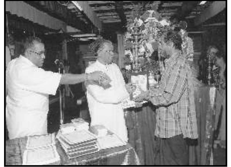
திருவெம்பாவை காலத்தில் திருவாசகம் முற்றோதலுக்கு ஒழுங்காக வரவு தந்தமைக்கான கேடயம் வழங்கும்பொழுது

முற்றோதல் நடைபெற்ற 10 நாட்களும் ஒழுங்காக வரவு தந்தமைக்காக எட்டு சிவனடியார்கள் பாராட்டுக் கேடயம் வழங்கி கௌரவிக்கப்பட்டனர். பங்குபற்றிய அடியார்கள் யாவருக்கும், சான்றிதழ்களும் புத்தகப் பரிசில்களும் வழங்கப்பட்டன. விசேட அபிசேக ஆராதனைகளும் பக்தி சிரத்தையுடன் நடைபெற்றன.