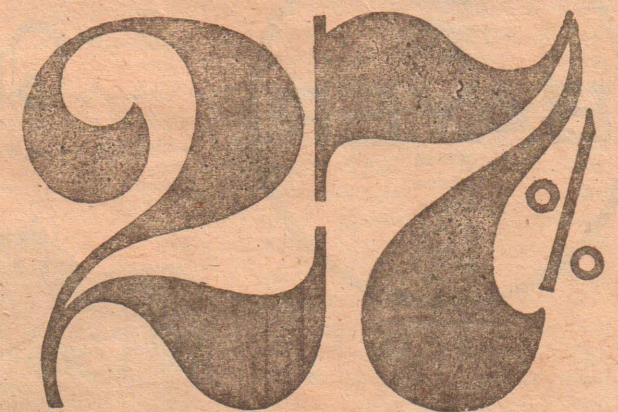
இலங்கையில் இரண்டாவதாக ஆரம்பமான பிளுன்ஸ் கம்பனி. ஸ்தாபிதம்: மே 1940-ம் ஆண்டு