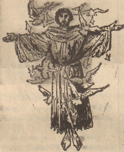
புனித பிரான்சிஸ் அழைக்கிறார்

இறைவா! அமைதியின் தூதுவனாக என்னைப் பயன்படுத்தும். பகையுள்ள இடத்தில் பாசத்தையும், மனவேதனையுள்ள இடத்தில் மன்னிப்பையும், ஐயமுள்ள குழுவில் விசுவாசத்தையும், அவதம்பிக்கையுள்ள மனதில் நம்பிக்கையையும், இருள் சூழ்ந்த இடத்தில் ஒளியையும், துயரம் நிறைந்த உள்ளத்தில் மகிழ்ச்சியையும், வழங்கிட எனக்கு அருள் புரியும்,